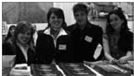
Studenti del "Renda" alla Bit di Milano lo scorso anno